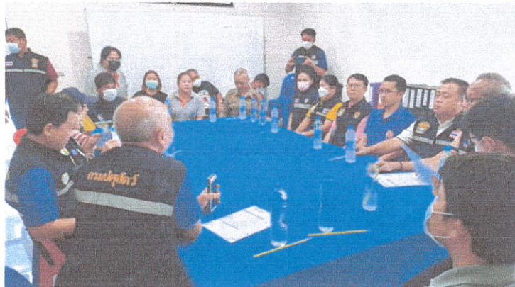
ภาพประกอบการดำเนินการป้องกันและปราบปรามสินค้าเกษตรผิดกฎหมาย