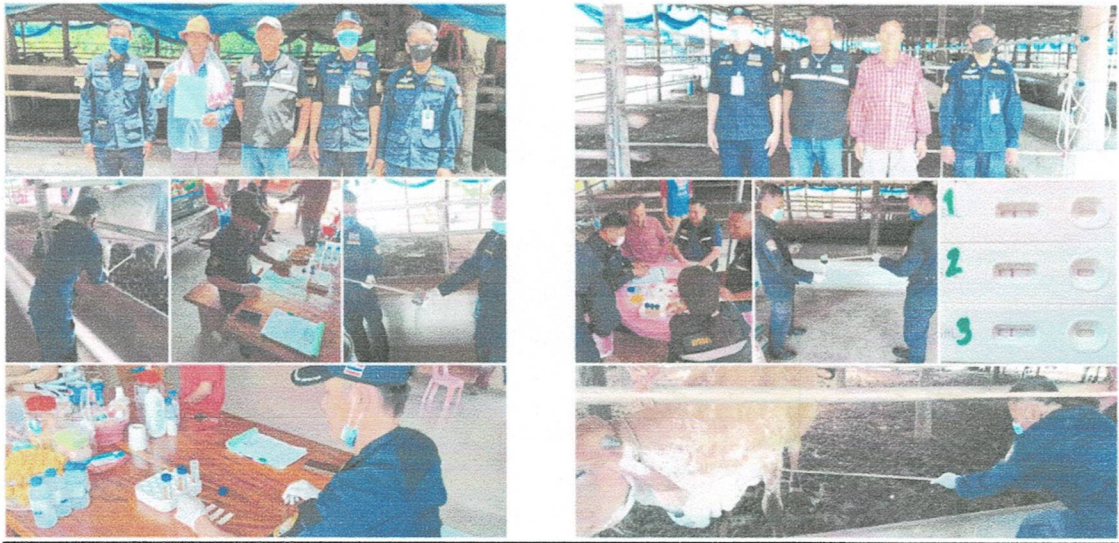
(ต่อ) ภาพโครงการสุ่มตรวจการลักลอบใช้สารเร่งเนื้อแดงในโค กระบือ