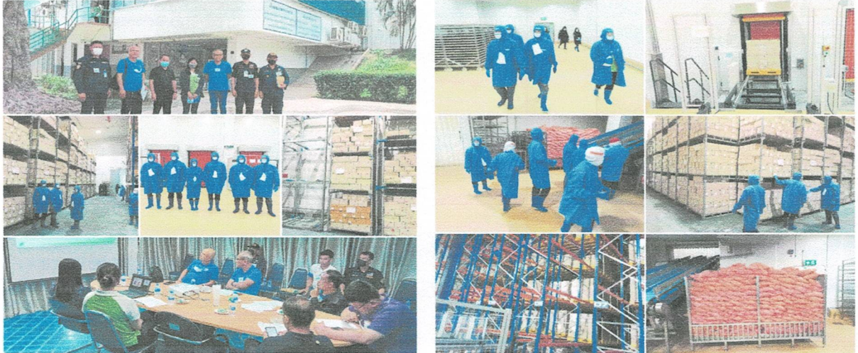
ภาพโครงการตรวจสอบห้องเย็น เพื่อปราบปรามขบวนการลักลอบนำเข้าซากสัตว์

- บริษัท เอฟ แอนด์ เอฟ ฟู้ด จำกัด เลขที่ ๖๑ ม.๓ ต.บ่อสุพรรณ อ.สองพี่น้อง จ.สุพรรณบุรี