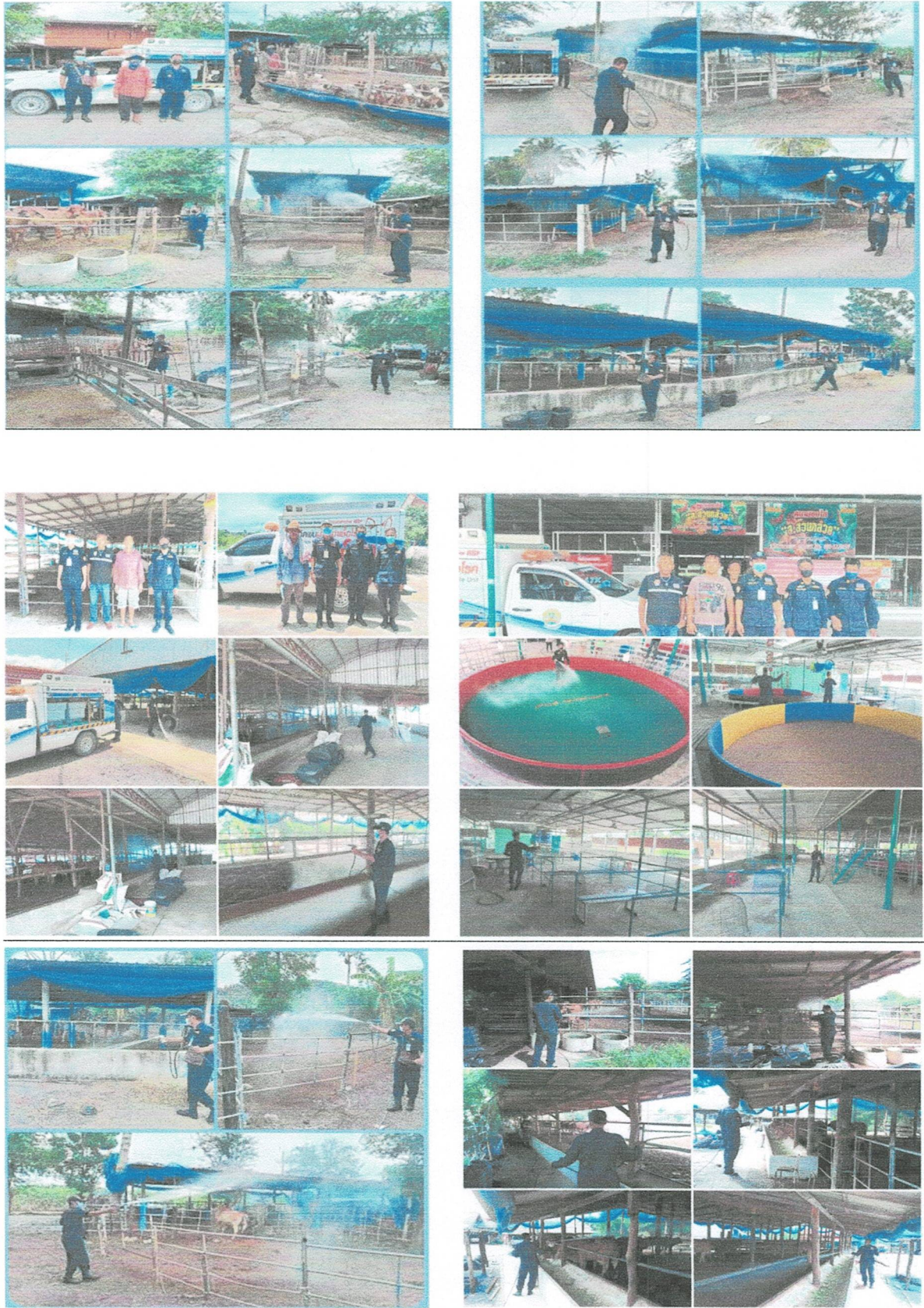
(ต่อ) ภาพโครงการพ่นน้ำยาฆ่าเชื้อ เพื่อป้องกันการแพร่โรคระบาดสัตว์ในพื้นที่เสี่ยง