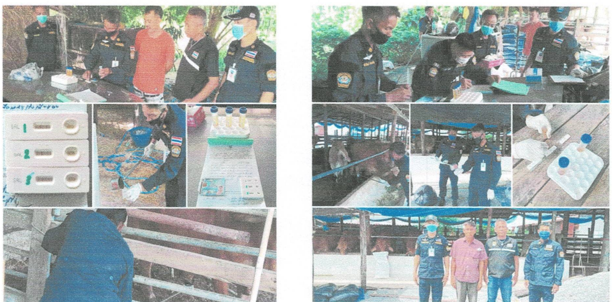
ภาพโครงการสุ่มตรวจการลักลอบใช้สารเร่งเนื้อแดงในโค กระบือ